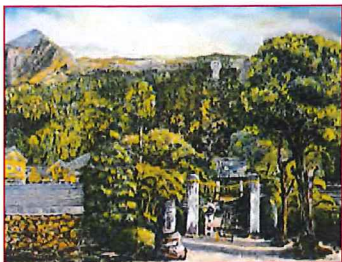
高橋武雄さん（埼玉県）の作品