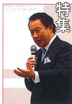
岡野裕基金記念講演会